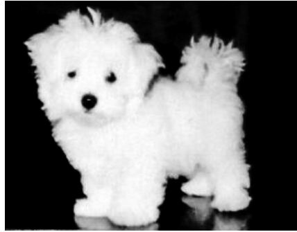
図3) レイちゃん。うん、可愛い。

(1) 小さく丸まっこく、(2) つぶらな瞳で、(3) 鼻にかかった声でクゥーン。やっぱり可愛いは最強だ。