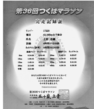
図 1) 走る小瀬村先生と筆者のつくばマラソンの完走記録証。

走る小瀬村先生の写真を母に見せたところ「あらあ、面白そうな人が上司でよかったじゃない」と言われた。